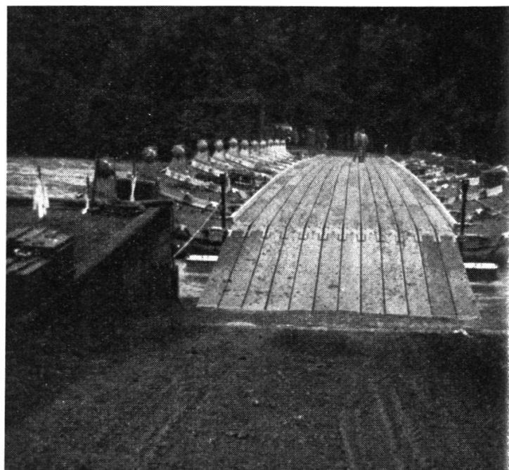
4. Le pont flottant terminé permet le franchissement de véhicules de 50 t.