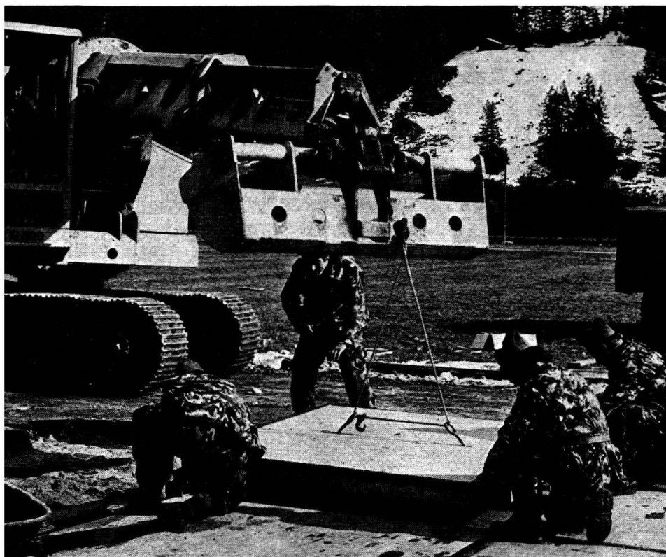
Une cp G av en pleine réparation d'une piste.

Après un bombardement, la remise en état des pistes est une des missions très importantes du rgt aérod.