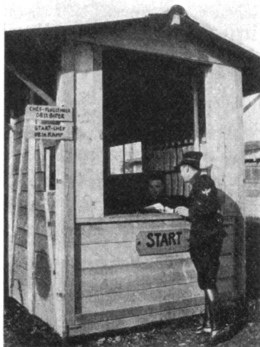
De ces débuts modestes...