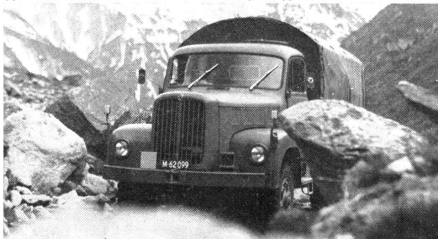
Camion Saurer-Berna à traction intégrale, type 2DM/2VM, en service depuis 1964 comme camion et basculeur.