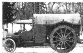
Tracteur militaire Saurer, 1918.