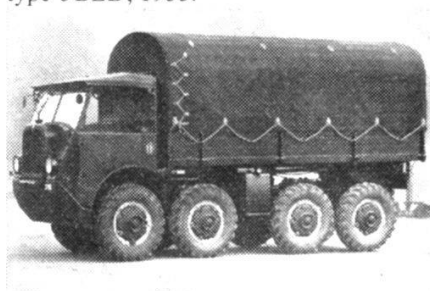
Camion militaire Saurer-Berna à traction intégrale, type M8, 1943.