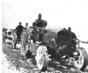
Tracteur d'artillerie Berna, 1918.