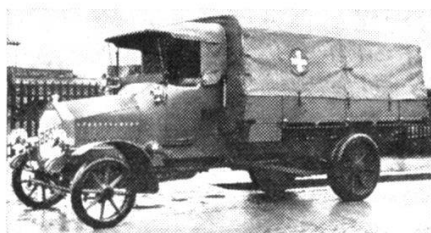
Camion militaire Berna, type C2/GC, 1914.