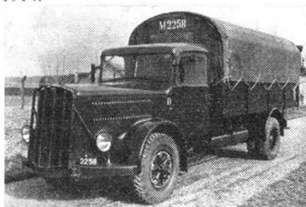
Camion militaire Saurer-Berna, type 4CT1D, 1941.