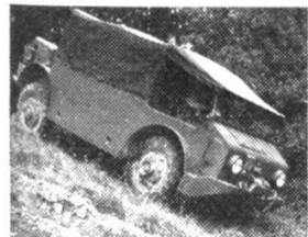
Véhicule d'artillerie Saurer-Berna à traction intégrale pour le transport de troupes et le remorquage, type 4MH, 1946.