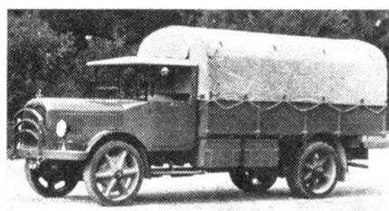
Camion militaire Saurer-Berna, type 5BLD, 1933.