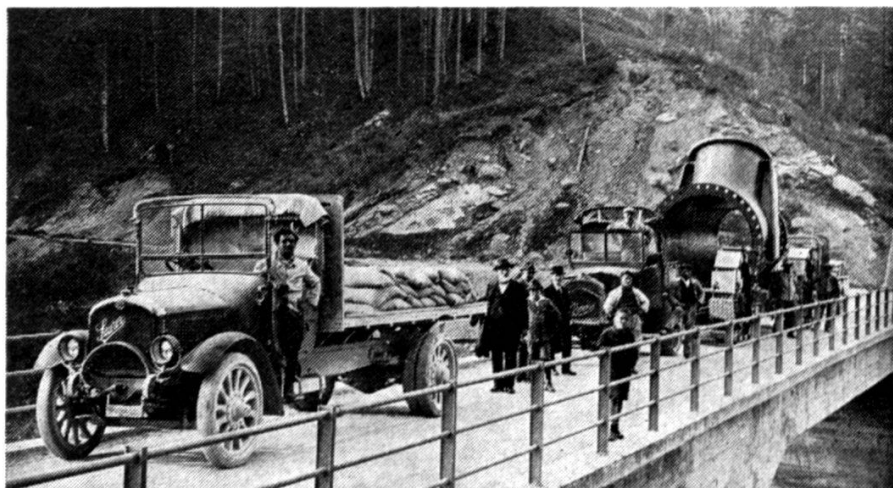
En 1926 déjà, Saurer et Berna tiraient ensemble un transport lourd dans le Wägital.