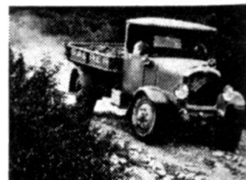
Basculeur Saurer de 1928.