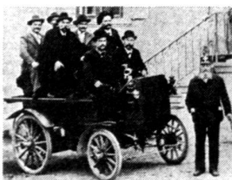
Premier camion Saurer, 1896.