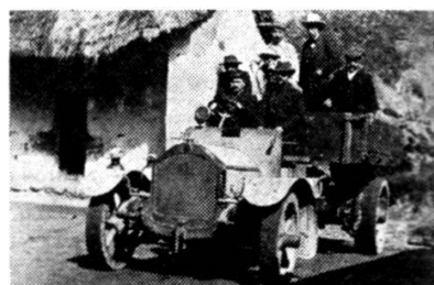
Camion Saurer à benne basculante, 1912.