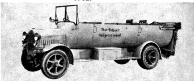
Omnibus Berna ouvert de 1922.