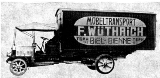
Déménageuse Berna de 1914.