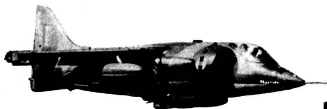
HS Harrier V/STOL

Ce serait sans doute une tâche très difficile de réparer les pistes, surtout si l'on est en présence de bombes à retardement ou des retombées de bombes nucléaires. Imaginez un peu le chaos! Il ne suffit pas de remplir les cratères de bombes avec du béton, mais d'entreprendre un gros travail de génie civil, avec beaucoup de main d'œuvre et de machines qui devraient être immédiatement disponibles à l'endroit même de l'attaque.