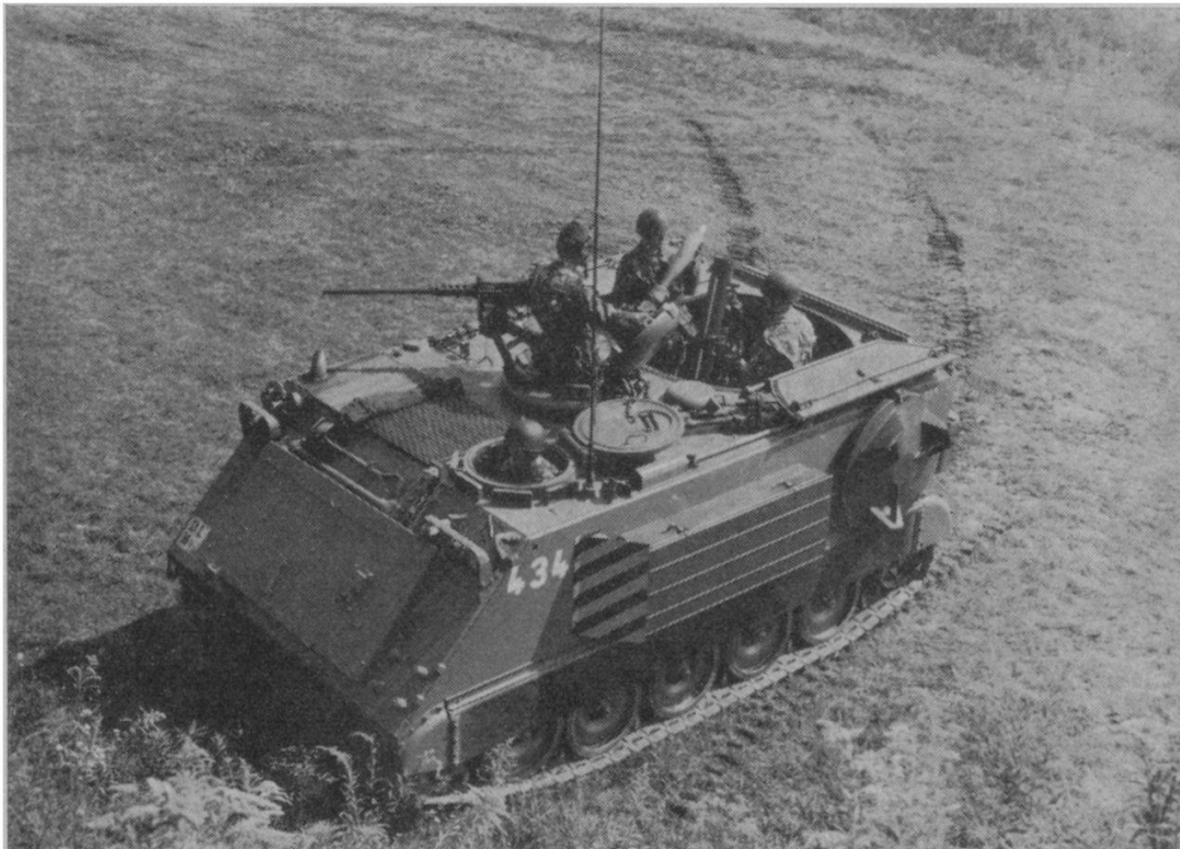
Char lance-mines 64.

La section de lance-mines de chars est richement dotée en munition; elle est équipée d'obus brisants, de fumigènes/incendiaires, bientôt d'obus