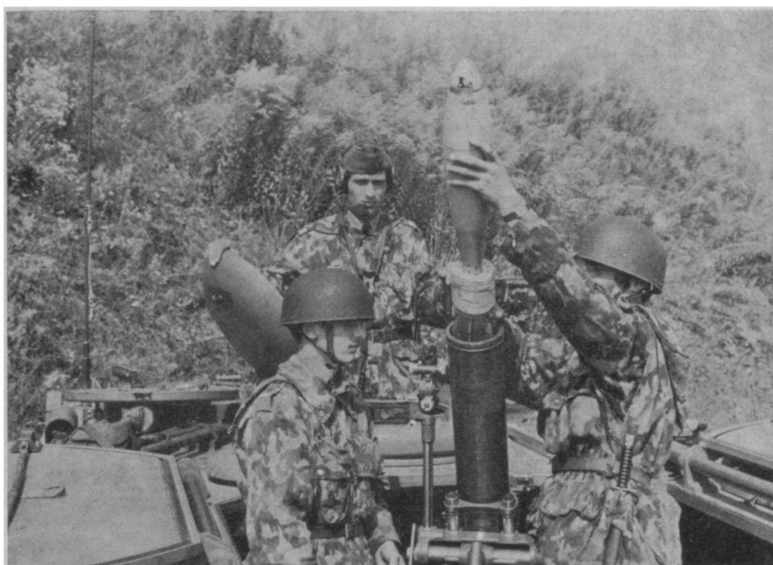
Chef de pièce (sof), pointeur et chargeur durant le tir.

calqué sur celui de l'artillerie. Ordres de feu identiques, plan des besoins de feu normalisé, terminologie unifiée, introduction du désaccord font que le commandant de tir d'artillerie et celui de la section de lance-mines de chars parlent (presque) le même langage. Par contre, l'absence d'organes topographiques et météorologiques, comme aussi le caractère simplifié des instruments de calcul des feux, obligent les lance-mines de chars à se régler plus fréquemment. Le calcul du désaccord, lequel permet, dans un secteur donné, d'introduire le feu d'efficacité sans réglage préalable, donne aux lance-mines de chars la possibilité de mieux faire usage de l'effet de surprise.