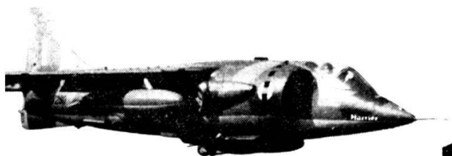
HS Harrier V/STOL

Ce serait sans doute une tâche très difficile de réparer les pistes, surtout si l'on est en présence de bombes à retardement ou des retombées de bombes nucléaires. Imaginez un peu le chaos! Il ne suffit pas de remplir les cratères de bombes avec du béton, mais d'entreprendre un gros travail de génie civil, avec beaucoup de main d'œuvre et de machines qui devraient être immédiatement disponibles à l'endroit même de l'attaque.