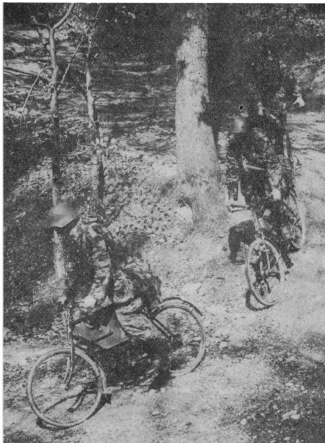
Fig. 3. — ... leur faculté de se mouvoir dans tous les terrains ...