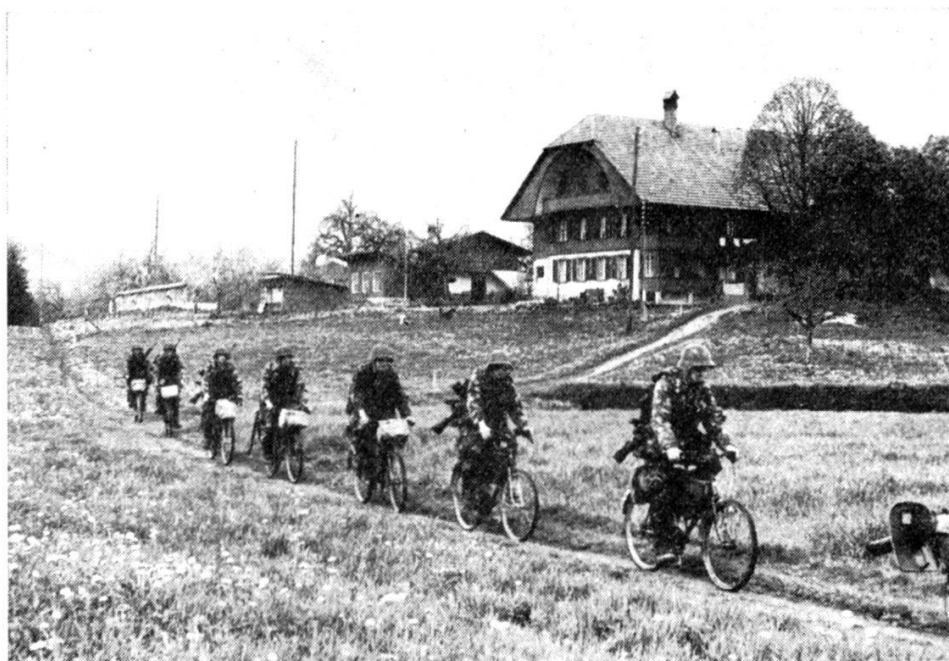
Fig. 1. — Les cyclistes se déplacent rapidement, même sur des sentiers, et ne représentent pas de but rentable pour l'aviation.

Les cyclistes ne sont pas la fierté des cantons; l'effort et l'endurance exceptionnels que demande la propulsion de leur machine est de loin