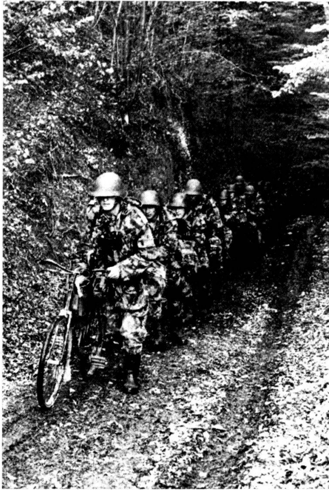
Fig. 4. — ... leur approche silencieuse amène la surprise.