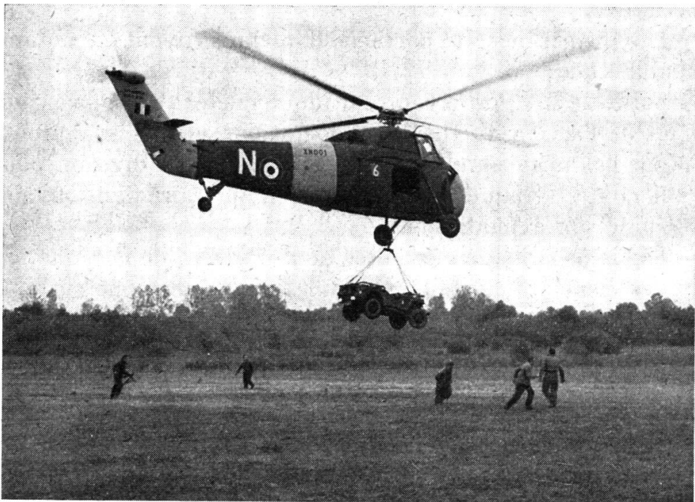
Manœuvres d'automne. Région de Besançon. Une jeep est amenée au point d'intervention par un hélicoptère Sikorsky.