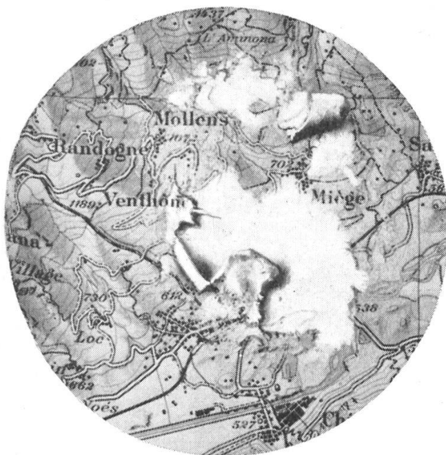
Papier normal 20 frictions à l'état humide

Le problème qui nous intéresse particulièrement est celui des possibilités et des avantages qu'offre ce nouveau produit dans le domaine de la cartographie, notamment militaire.