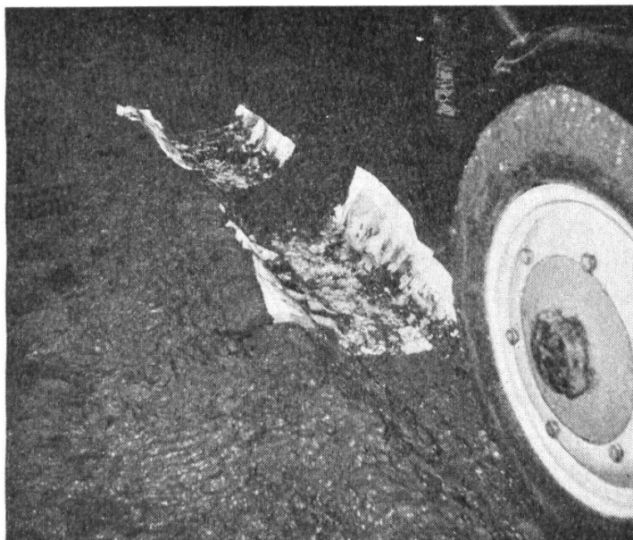
Ces cartes topographiques, imprimées sur SYNTOSIL, passées plusieurs fois sous les roues d'un tracteur lourd, sont pourtant demeurées intactes.

Nous précisons que le Service topographique fédéral à Berne a déjà autorisé l'impression sur Syntosil de cartes de certaines régions de la Suisse, notamment du Gothard, du Tessin, du Lac des Quatre-Cantons et du Mont-Blanc au 50 millième et de Bâle et Engelberg