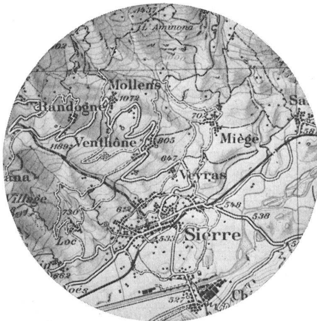
SYNTOSIL 200 frictions à l'état humide

Test de résistance à la friction, opéré par le Laboratoire fédéral d'essai des matériaux, à Saint-Gall.