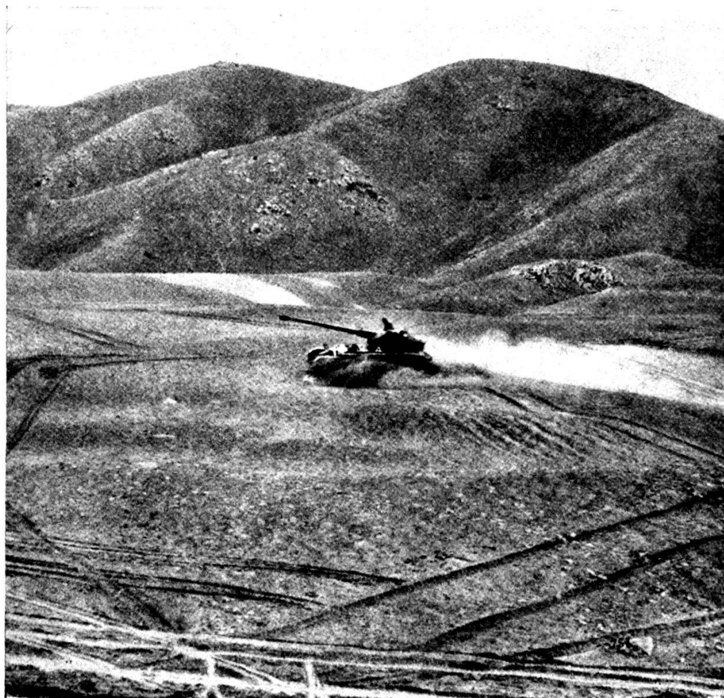
Un char AMX en mouvement dans les sables.

Et, le 2. 11 seulement, il le rejoignit près de Bir Gifgafa où, vers 1400, un combat de chars s'engagea et dura jusqu'à la nuit. Les AMX français, qui se mesuraient aux T 34 et aux SU 100 russes, firent preuve, dans les sables et dans les éboulis, de beaucoup de maniabilité, et leur excellent canon de 7,5 cm. — qui avec 1000 m. de Vo lance un obus capable de percer un blindage de 14 cm. à 1,5 km. — se montra tout à fait suffisant sur les chars lourds très modernes de la « Brigade russe ». Même si nous n'ignorions pas les avantages de