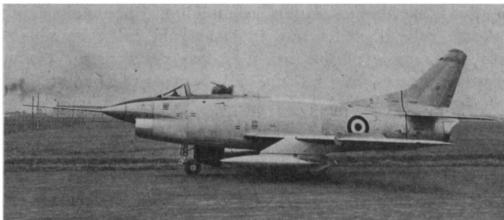
Le Fiat G. 91 (Italie)

La conception de l'OTAN est par ailleurs intéressante en ce sens qu'elle marque une réaction contre l'augmentation incessante du poids des avions de combat. Lors de la guerre de Corée, les pilotes américains ont pu constater que les avions soviétiques présentaient un degré de rusticité bien plus grand, qui se traduisait finalement par un poids moindre et des performances supérieures. Le développement de la technique a par ailleurs permis de miniaturiser et de rendre insensibles des parties nombreuses de l'équipement des avions. Profitant enfin du développement incessant des réacteurs qui voient leur poids spécifique sans cesse amélioré, les responsables de l'OTAN sont arrivés à la conviction que le retour à des formules désormais moins lourdes était une des conditions essentielles dans