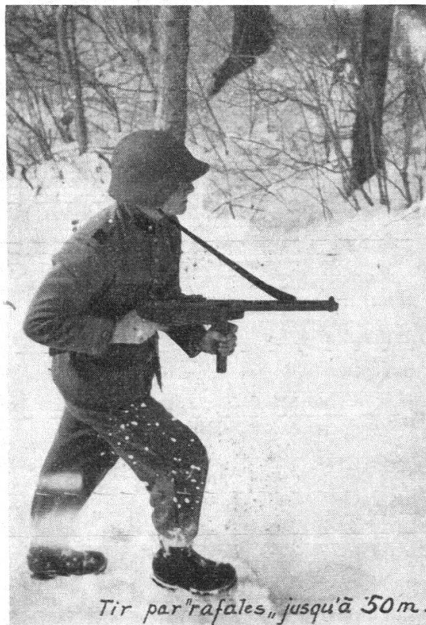
Tir par "rafales" jusqu'à 50 m.

Selon nos règlements, la mitrailleuse 43 n'est prévue,