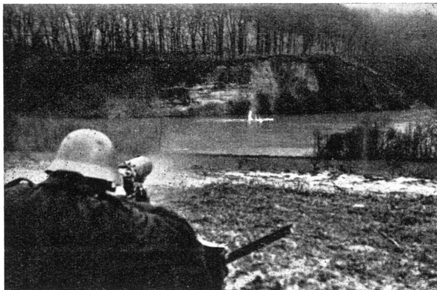
Vue sur la falaise de la rive dr. 4 sentinelles étaient placées dans un rayon de 500 m. au delà de la falaise. Coupure dans la haie rive g. d'environ 160 ‰.