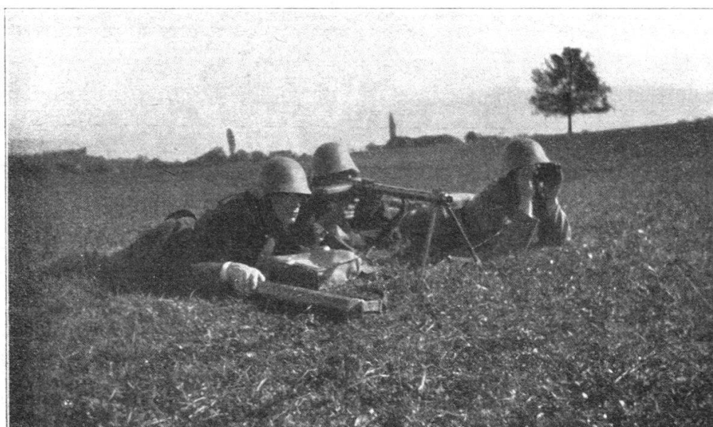
Fig. 5. Groupement formel des servants.

Nous avons vu qu'un des arguments en faveur de la thèse du service F. M. assuré par le seul tireur, se basait sur la