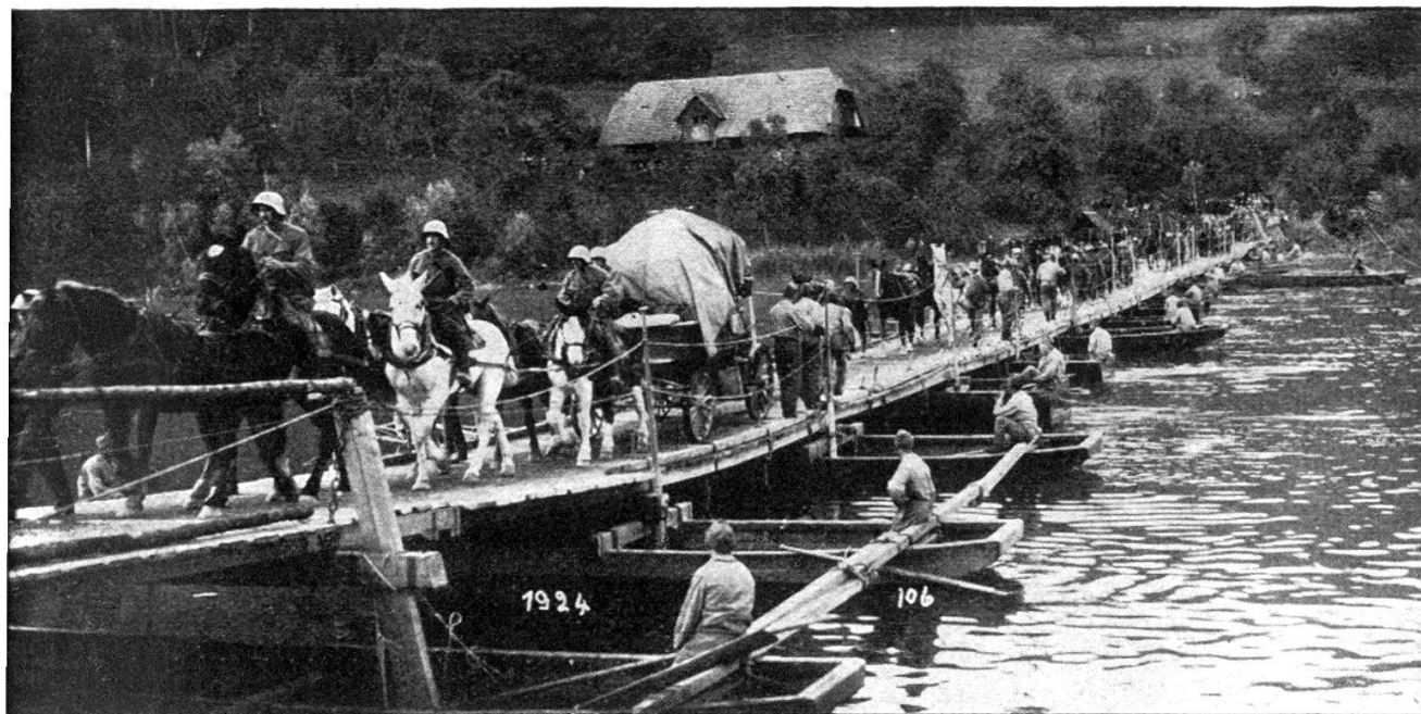
Le pont de colonnes de Golaten (p. 218).

Le matériel d'un E. P. D. qui est de 40 m. de pont de colonnes, se prêterait tout juste à la construction d'un pont lourd de 16 mètres seulement . Que représentent 16 mètres de pont