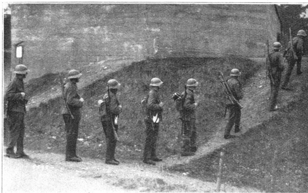
Fig. 6. Equipe de mitr. lég. en colonne par un : 1. caporal (jumelles) ; 2. tireur (Fusil Furrer et appui antérieur) ; 3. aide-tireur (porteur de l'étui avec canon de rechange) ; 4. 5. 6. pourvoyeurs des munitions (sac de 300 cart. et gourde à eau) ; 7. 8. Fusiliers-mitrailleurs. Cette répartition de matériel n'est pas définitive.

le temps disponible pour l'instruction. Il est presque superflu de répéter que si nous avons et la méthode et les hommes