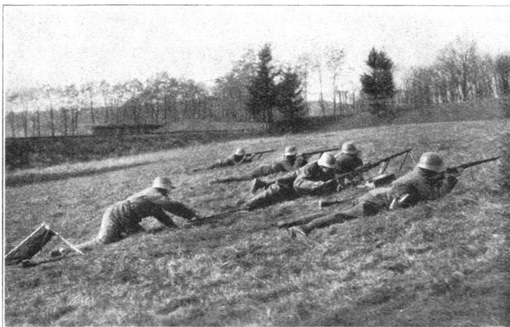
Fig. 8. Changement de canon pendant le tir de l'équipe. (Représentation schématique. Tuyau à eau pour le refroidissement du canon derrière la pièce.)

Mais si les formations ont changé, si la technique du feu a évolué et si l'armement est devenu plus complexe, nous de-