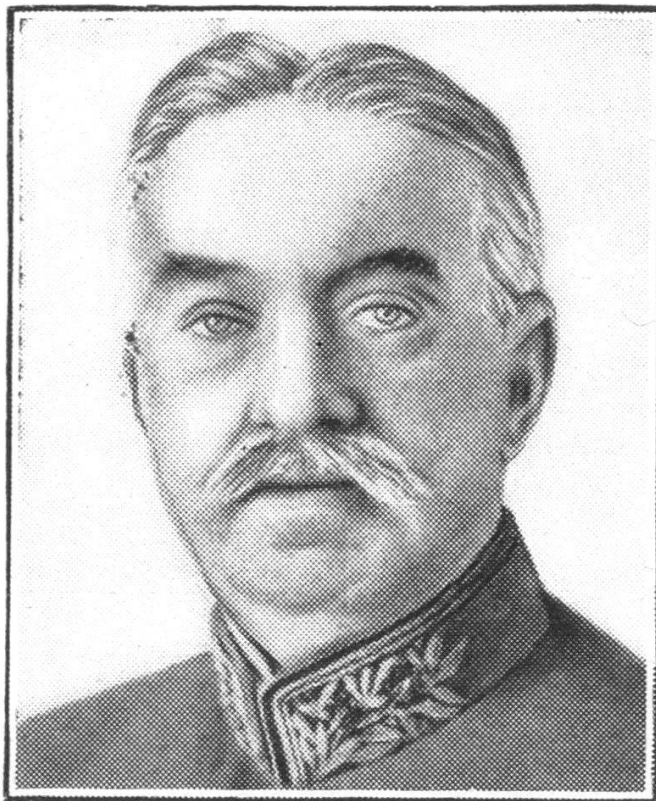
Le général Ulrich Wille.

l'instruction de l'armée. C'est farci d'excellents principes, de bonnes intentions et de sages conseils, nul ne le contestera, mais il a fallu toute notre bonhomie et notre désir de discipline pour ne pas rire ouvertement de ce filandreux sermon sur la montagne. On ne galvanise pas les soldats welsches avec des discours de ce genre, et les soldats welsches appartiennent aussi à l'armée. Si l'on veut être leur chef, il faut savoir leur parler leur langage comme aux soldats de la Suisse allemande le leur.