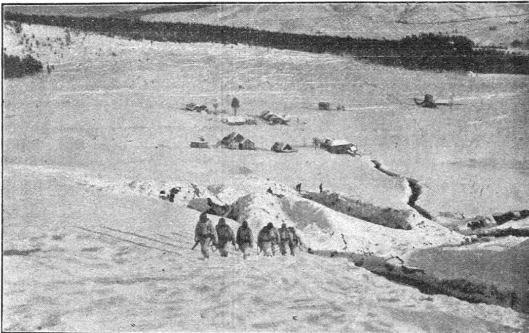
Patrouille sur le haut plateau d'Asiago.

L'offensive fut préparée cette année pendant plusieurs mois. Réduite à l'impuissance dans la montagne en raison des intem-