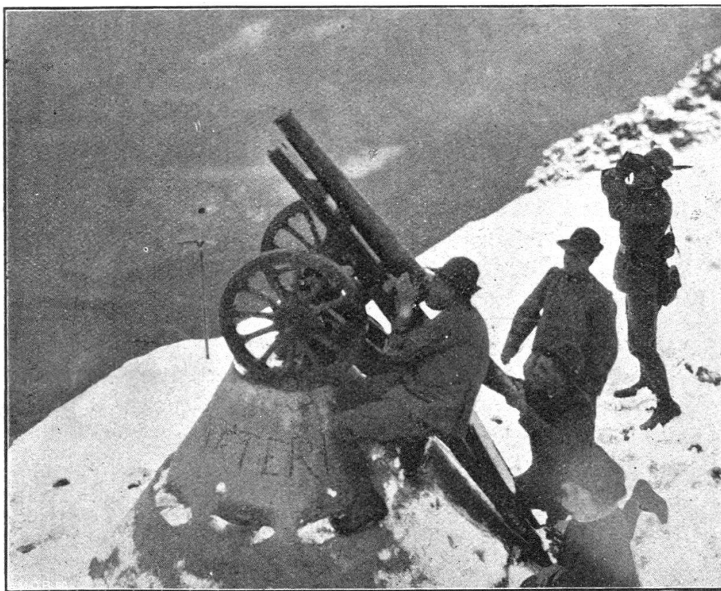
Canon anti-avion sur le Monte-Nero.

Tout ceci repose sur un plan de manœuvre génialement conçu. Si cette manœuvre n'a pas pu déployer des effets plus