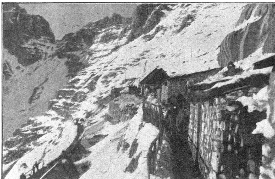
Baraques d'hiver en Carnie.

Pour les Italiens la possession de la tête de pont de Plava