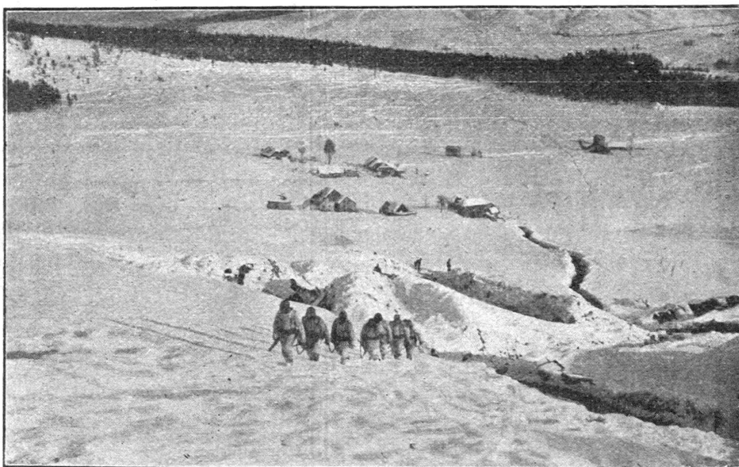
Patrouille sur le haut plateau d'Asiago.

L'offensive fut préparée cette année pendant plusieurs mois. Réduite à l'impuissance dans la montagne en raison des intem-