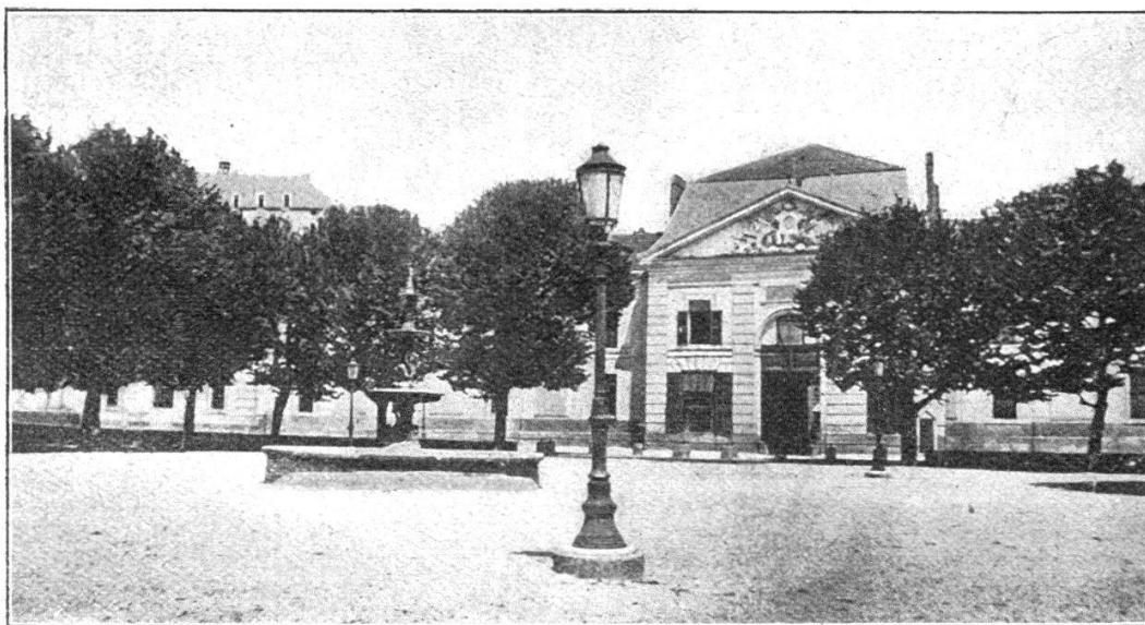
Type des casernes de Guillaumot. 1755.

La caserne de Courbevoie est chère à tout cœur de soldat suisse; depuis sa construction jusqu'à nos jours, elle tient la plus noble, la plus émouvante place dans la vie de l'armée française. Son histoire, qui rejoint très souvent la grande his-