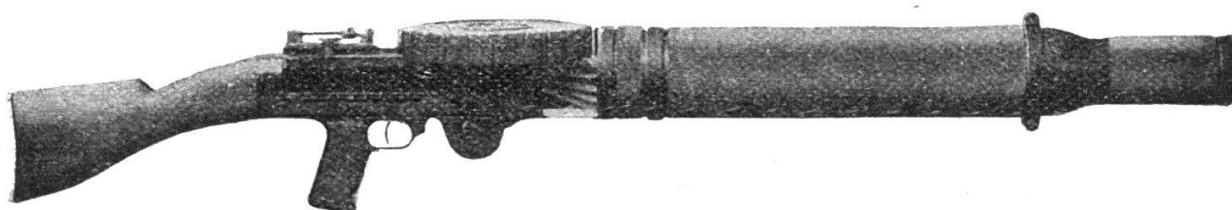
La mitrailleuse Lewis.

La Lewis est à canon unique : elle a emprunté à la Hotchkiss le principe du fonctionnement automatique par utilisation des gaz au départ du coup.