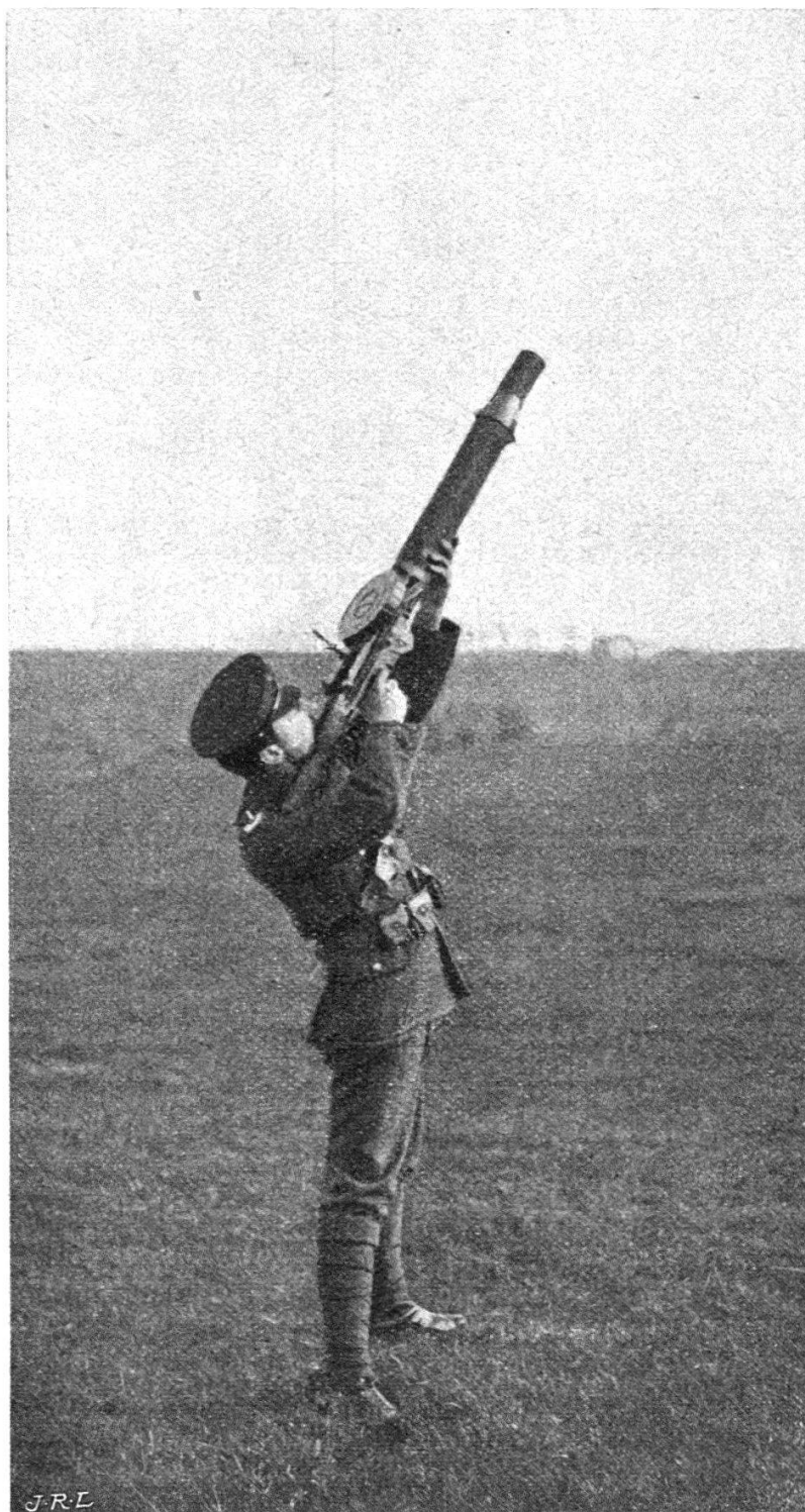
La mitrailleuse tirée à l'épaule.

et à la cavalerie. Mais ces caractéristiques principales ont amené l'inventeur à l'expérimenter pour le service des aéroplanes.