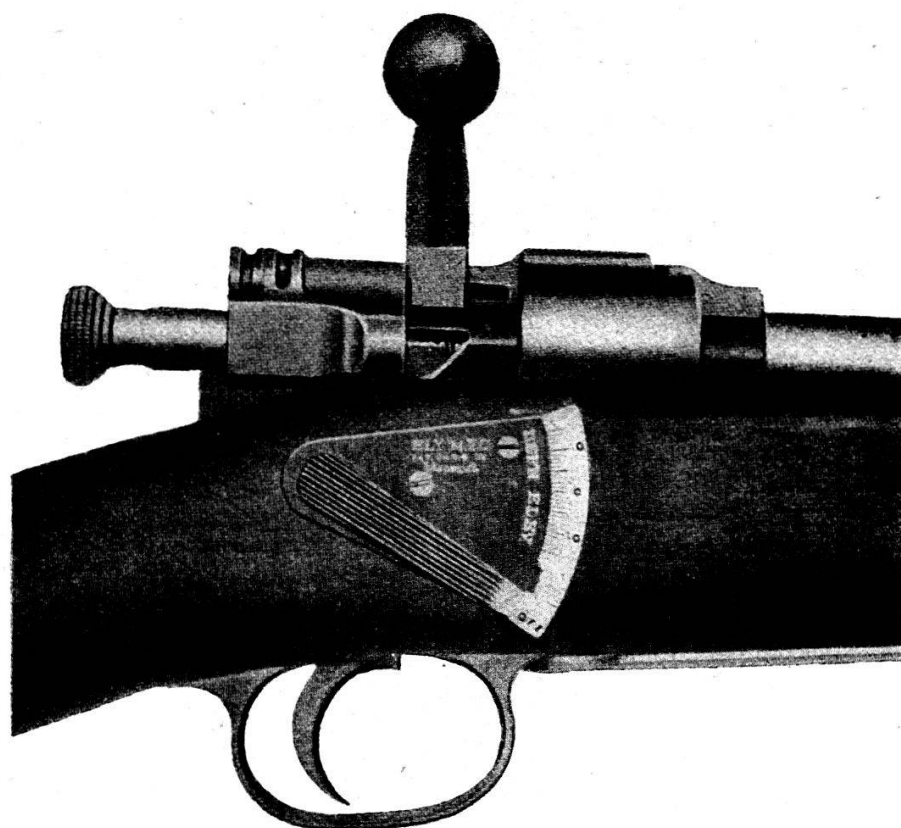
Le contrôleur Ely. — Springfield à magasin équipé avec le contrôleur modèle A. L'indicateur est au point « ouvert » (Off.)

Il y a deux modèles de contrôleur Ely. L'un, A, permet de