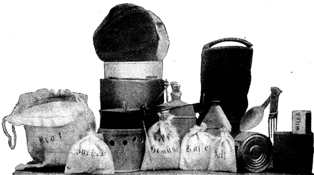
Le contenu du sac pour vivres et munitions.

C'est un rucksac , d'une hauteur de 40 centimètres et large de 38 centimètres ; il contient dans une poche extérieure à fermeture indépendante : la casquette , le sachet de propreté , la