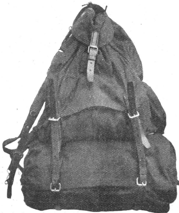
Le paquetage réduit .

En un paquetage réduit aux vivres et munitions , en détachant les deux sacs pour vêtements et chaussures et pour manteau ;