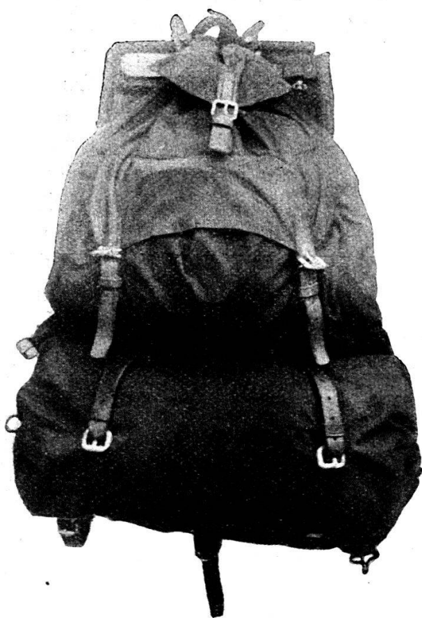
Le paquetage complet.

Poids total de l'effet d'équipement, » 1550 gr. au lieu de 2850 gr. que pèsent, réunis, le havre-sac et le sac à pain actuels.