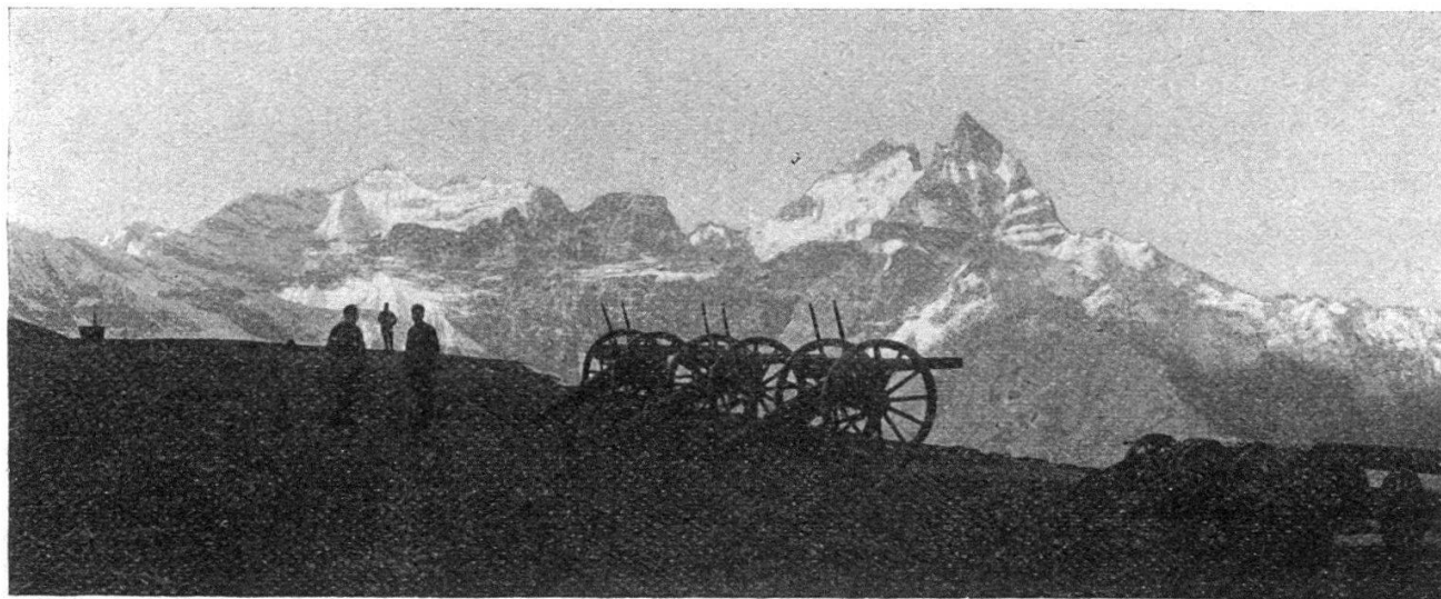
Forteresse. — Canons à Riondaz.

On a beau poser en principe qu'aucun citoyen ne doit ignorer les lois,