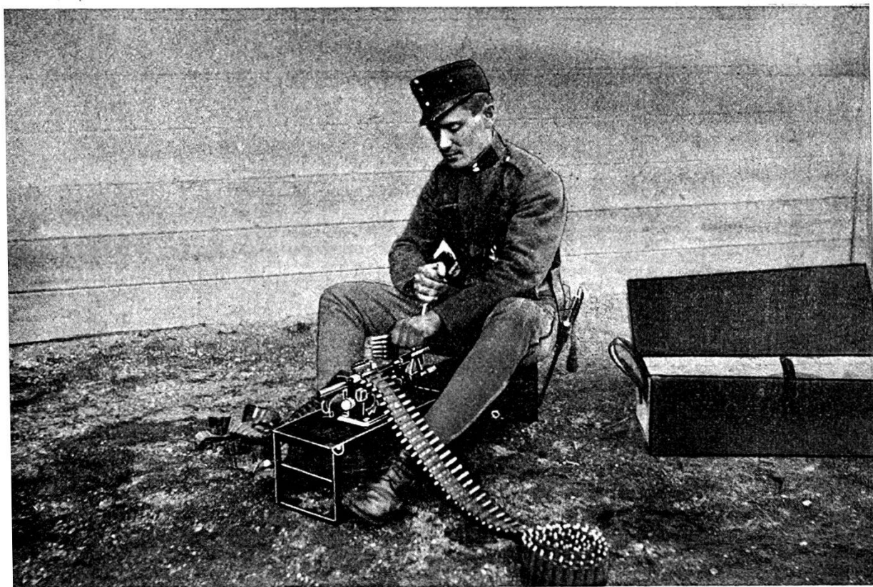
FIG. 1. — L'appareil Manfred Weiss en fonctionnement.

Nous publions ci-joint deux clichés que nous devons à l'obligeance de la maison Manfred Weiss, à Budapest. Ils représen-