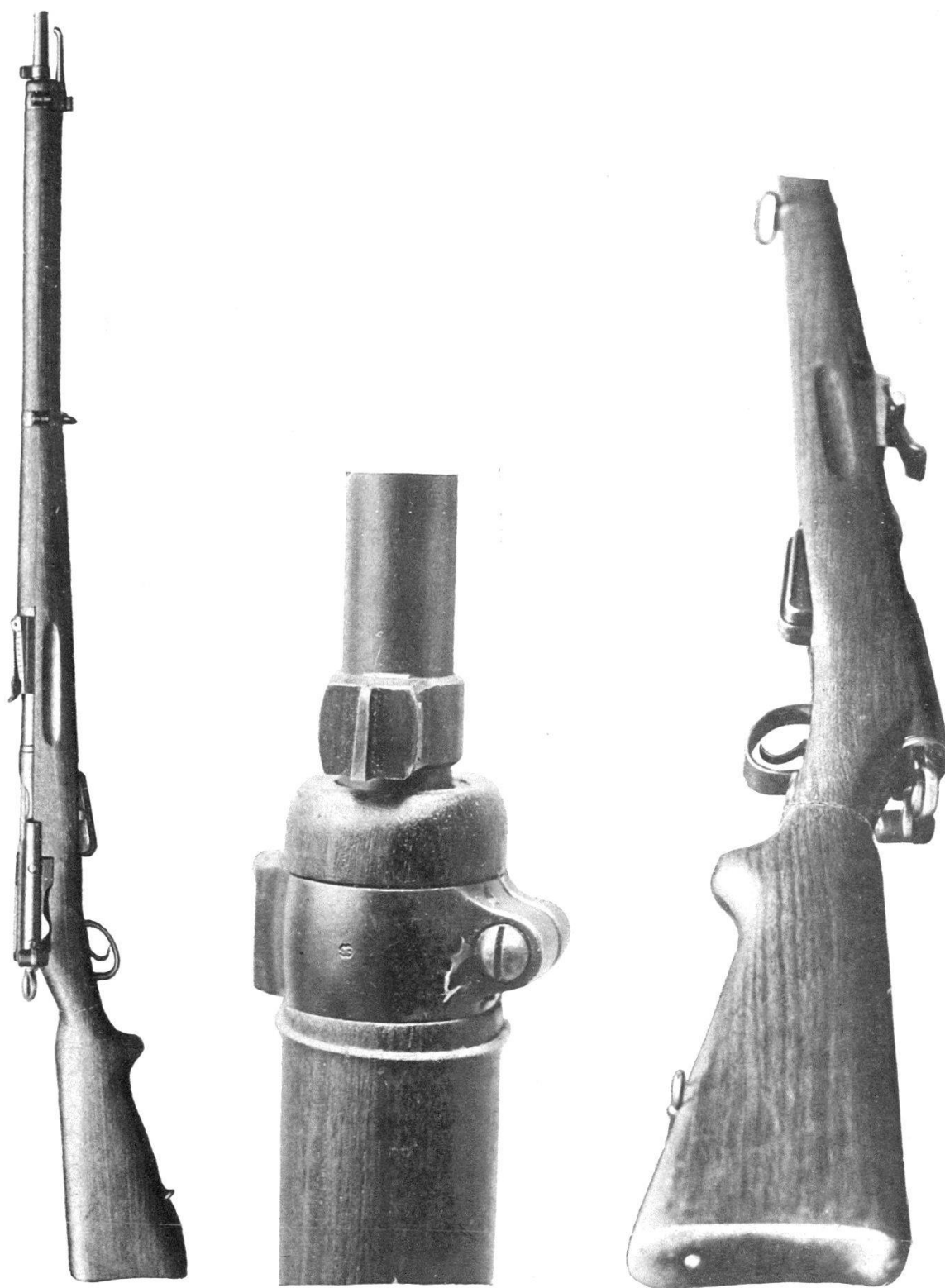
Le nouveau fusil d'infanterie.