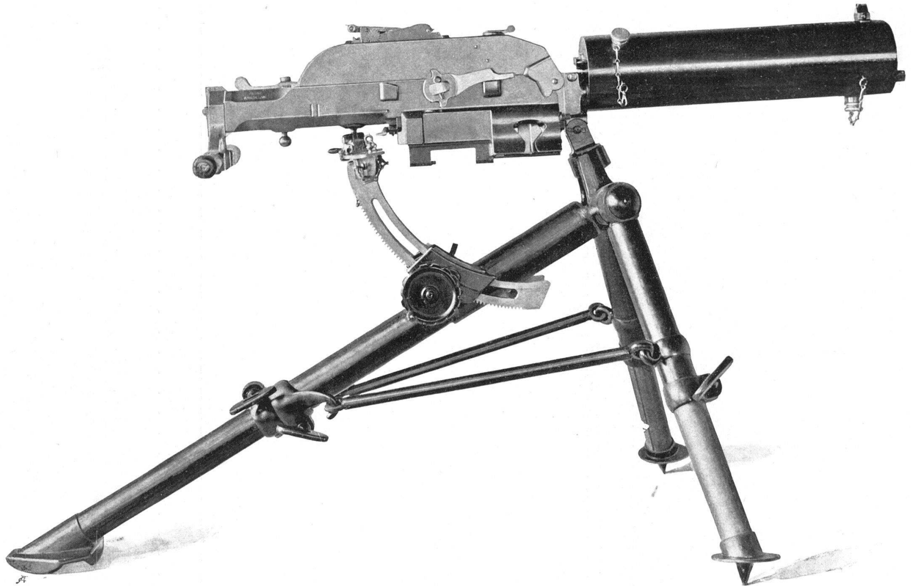
Mitrailleuse Schwarzlose, sur affût léger en forme de trépied, dans sa position de tir la plus élevée correspondant à une hauteur de tir de 60 cm. environ.