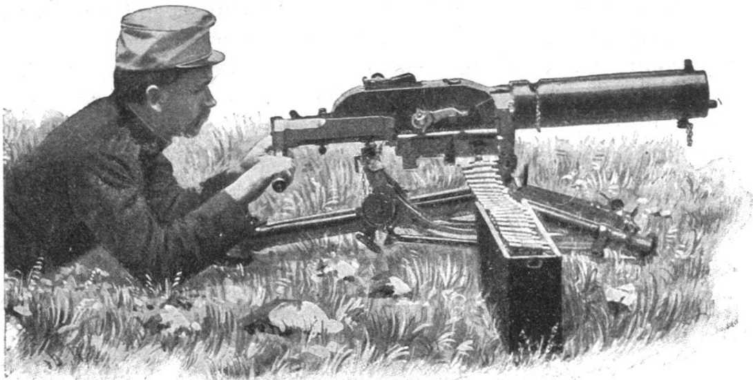
Fig. 2. — Mitrailleur Schwarzlose au tir, dans sa position la plus basse.