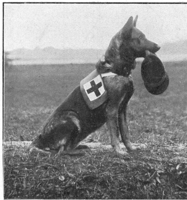
Fig. 2. — Nelly a apporté le képi du blessé à son maître et attend qu'on le lui prenne.