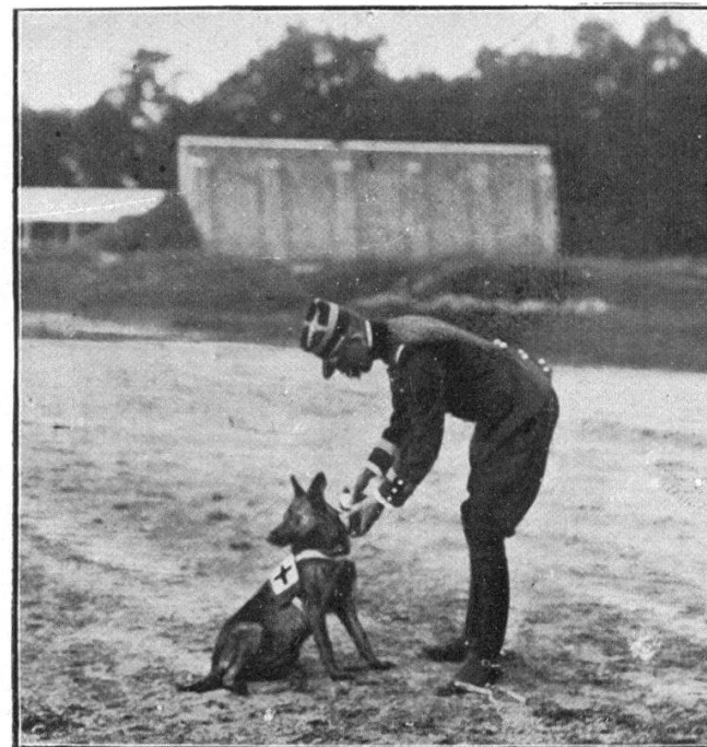
Fig. 4. — La réponse est placée dans la pochette spéciale du collier de Nelly .