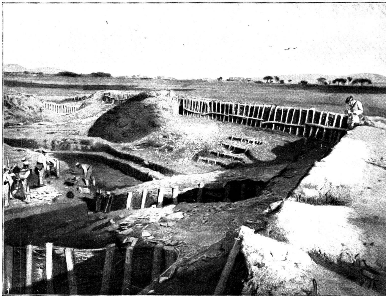
La grande redoute de Liao-Yang