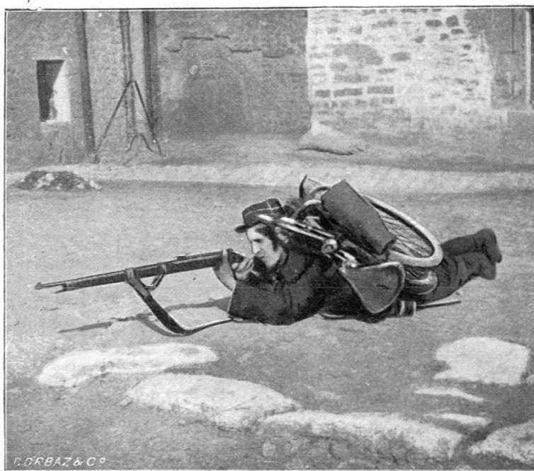
Cycliste tirant couché.