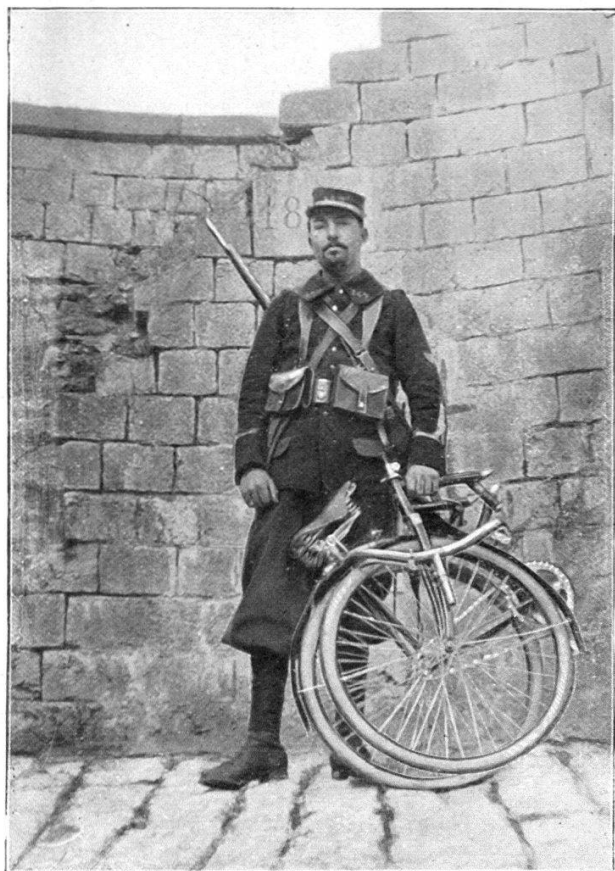
La bicyclette pliée