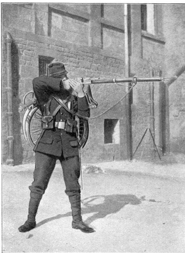
Cycliste tirant debout.