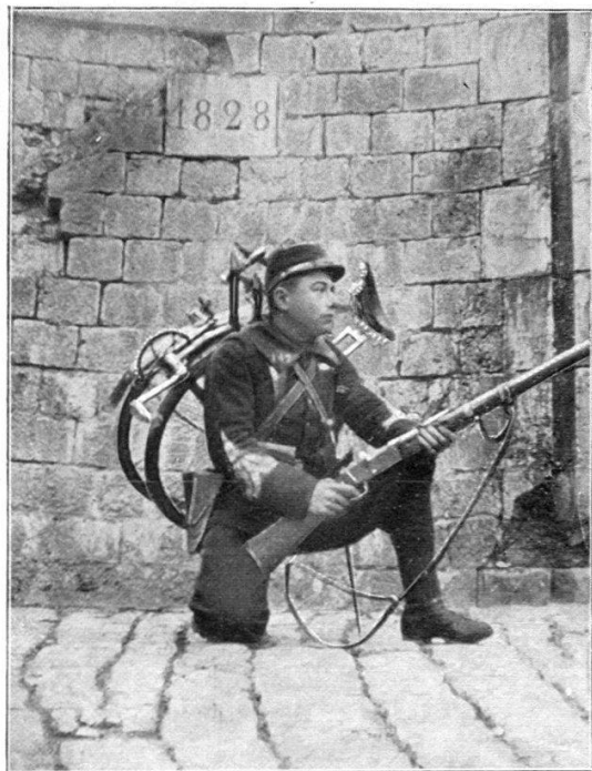
Cycliste prêt au tir à genou.