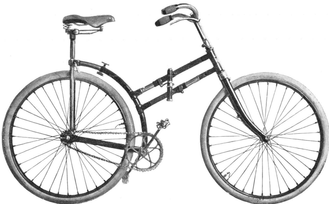
La bicyclette Gérard.