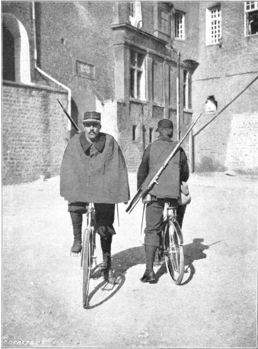
Cycliste monté à l'arrêt.