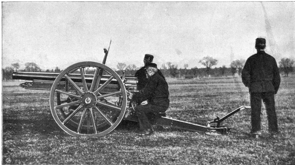
Canon Krupp de 7.5 cm. modèle 1902. La pièce au repos.