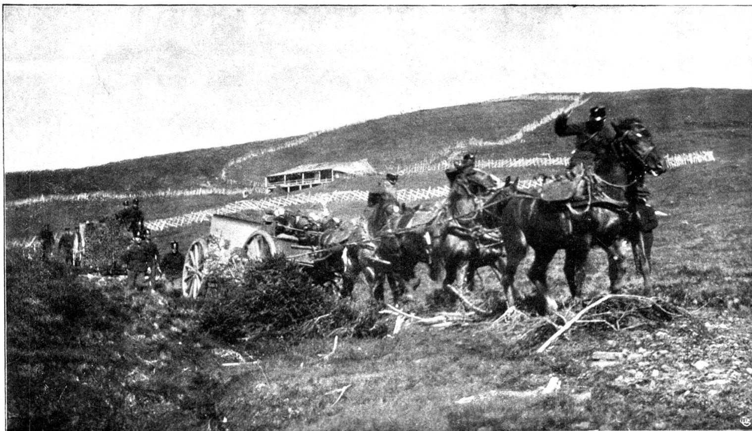
Canon Krupp de 7.5 cm. modèle 1902.