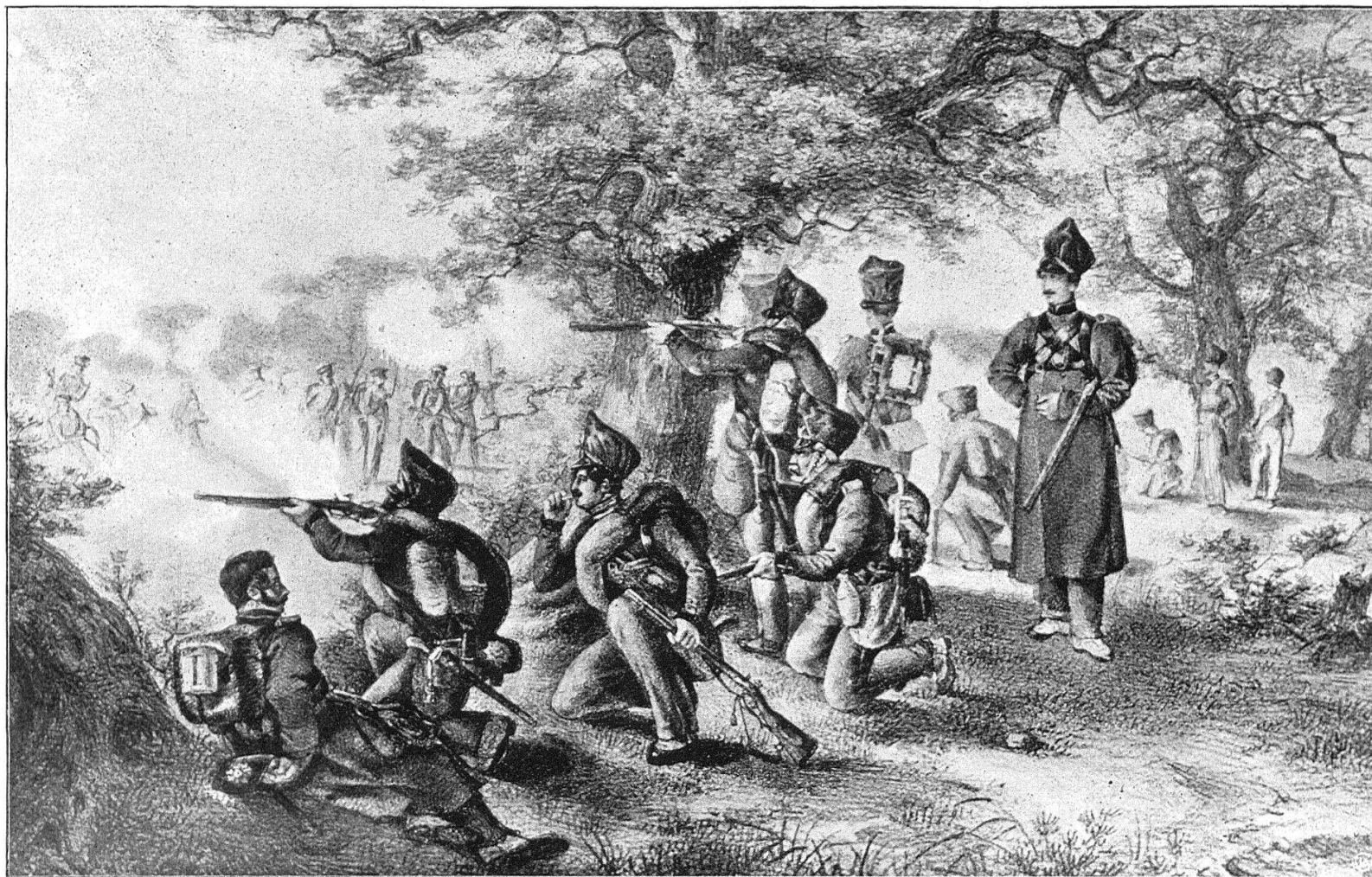
Un exercice de combat des Tirailleurs.