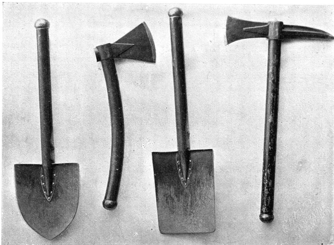
Outils avec le manche emboîté.