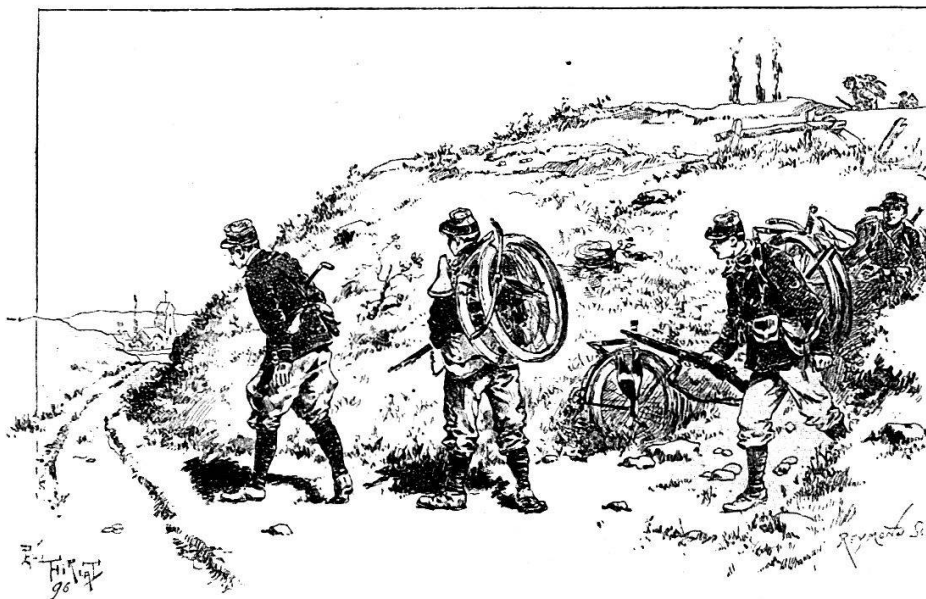
Cyclistes en reconnaissance porteurs de la bicyclette Gérard.