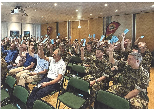
Un momento dei lavori assembleari.