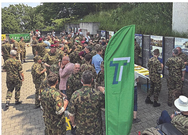
Aperitivo in Terrazza.