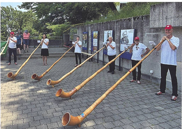
Il gruppo Cör & Cörni di Gordola.