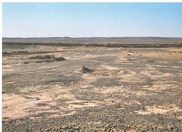
Zona lungo il Berm Amgala con soldato marocchino.