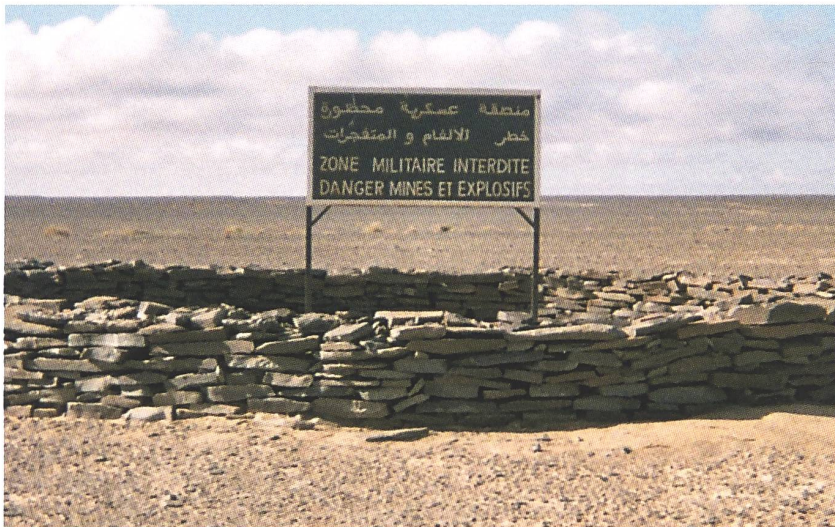
Cartello inizio zona di restrizione del lato marocchino.

Questo crea un paradosso operativo che mina la possibilità di soluzioni durature: MINURSO, priva di strumenti coercitivi e limitata nelle capacità operative, si trova oggi a operare in un quadro normativo superato incapace di riflettere l'attuale dinamica militare sul terreno, diventando testimone passivo di un conflitto attivo e in continua evoluzione.