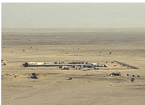
Un Team Site (TS Agwanit) di MINURSO nel deserto (East of Berm).

avamposti, l'installazione di sistemi radar avanzati e l'adozione di tecnologie per il monitoraggio remoto. Inoltre, sono stati segnalati, con conferme indirette, l'uso di droni da attacco e sorveglianza di origine turca e cinese come i Bayraktar TB2 e i Wing Loong II .