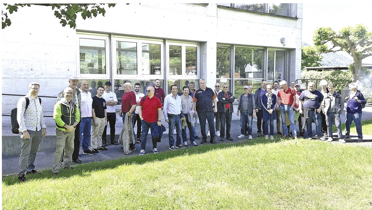
Foto di gruppo al termine dei lavori assembleari.