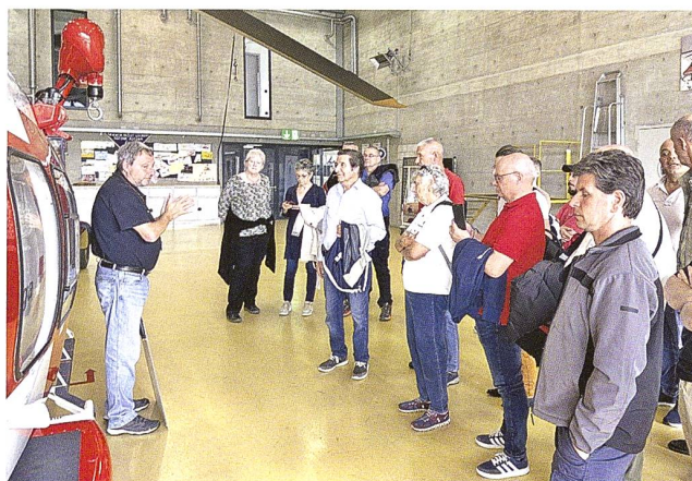
Un momento della presentazione.