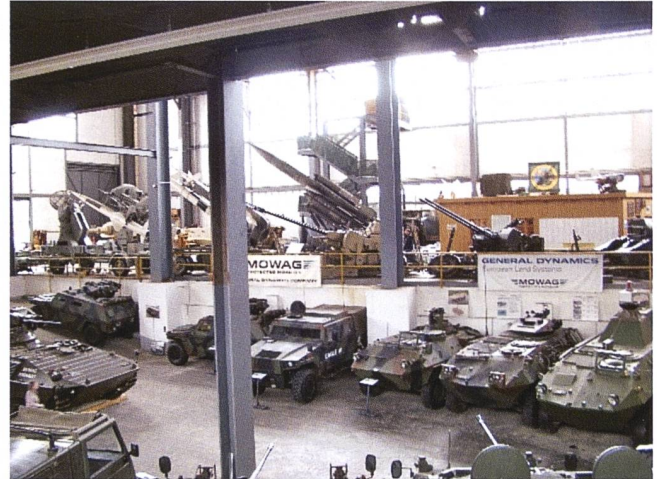
Sguardo su una parte della collezione del Museo di Reuenthal.

ha la possibilità di affinare competenze e capacità.