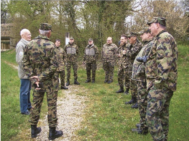
Gruppo di partecipanti orientato prima della visita alla Fortificazione di Full.