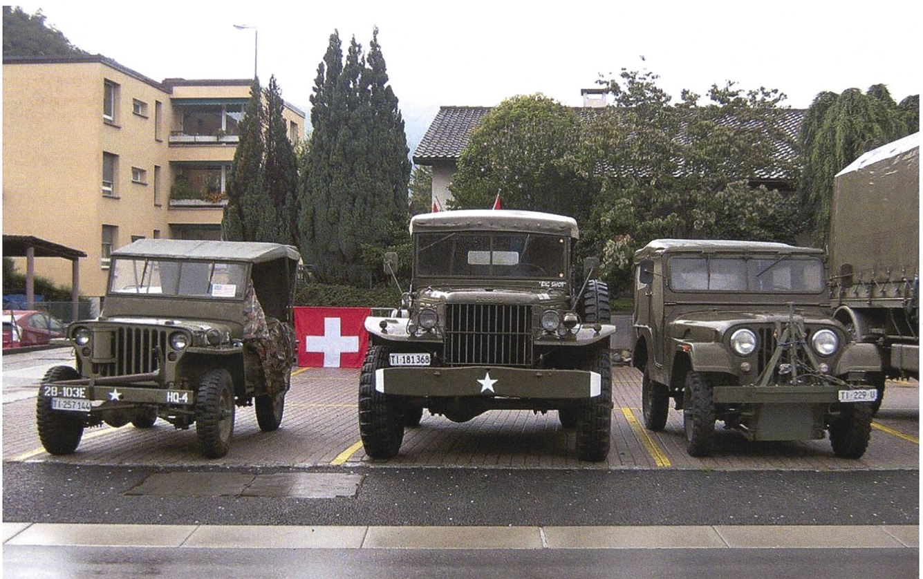
Incontro insubrico veicoli militari d'epoca nell'aprile del 2014 a Canobbio.

Altre informazioni sono disponibili sul sito: < https://www.haflipinz.ch/ > ♦