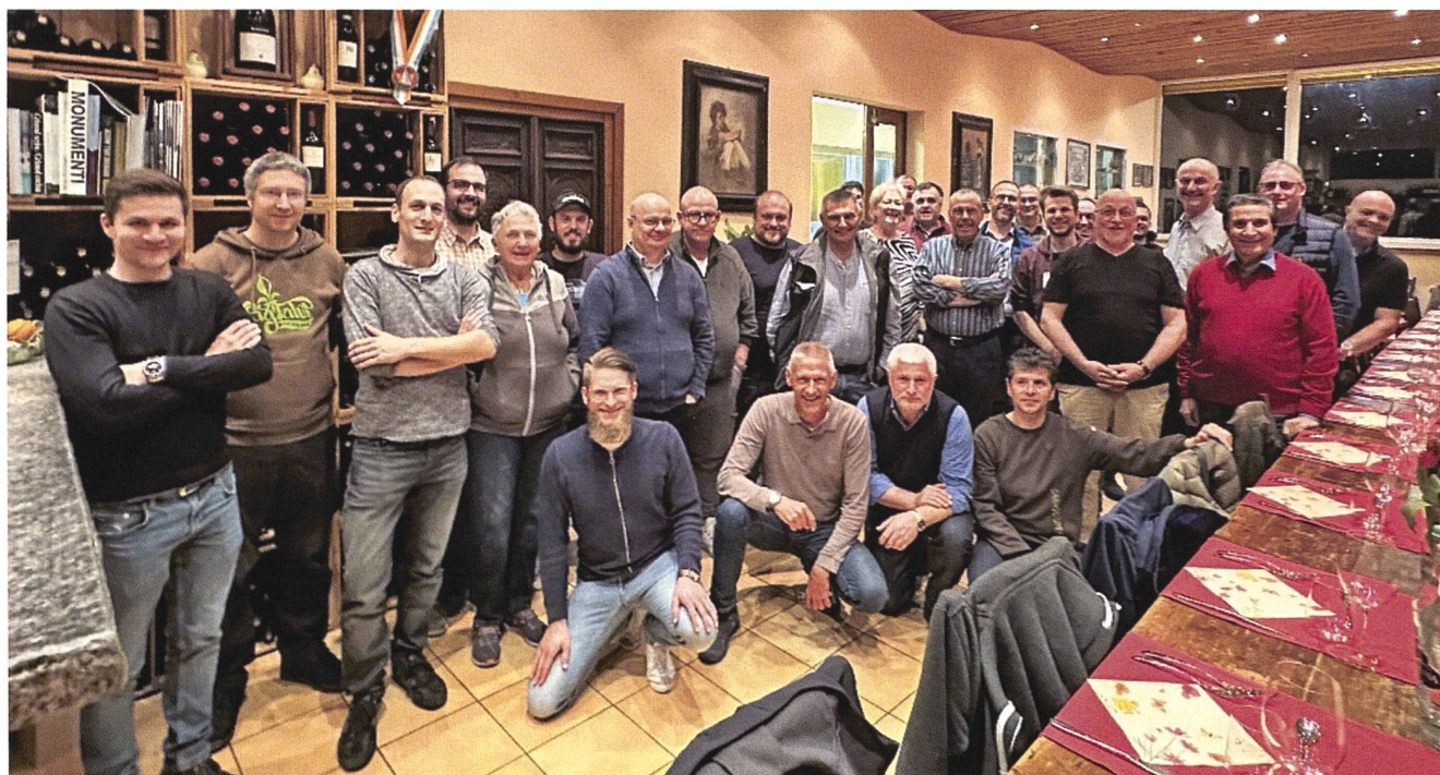
Foto di gruppo al termine dei lavori assembleari.

Un impiego su due giornate e con una tale dislocazione dalla Base ha richiesto uno sforzo organizzativo importante, un impegno supplementare a livello di gestione logistica dei veicoli e, non da ultimo, forte impegno alla guida. Prova superata per l'organizzazione che, confrontata con simili impieghi,