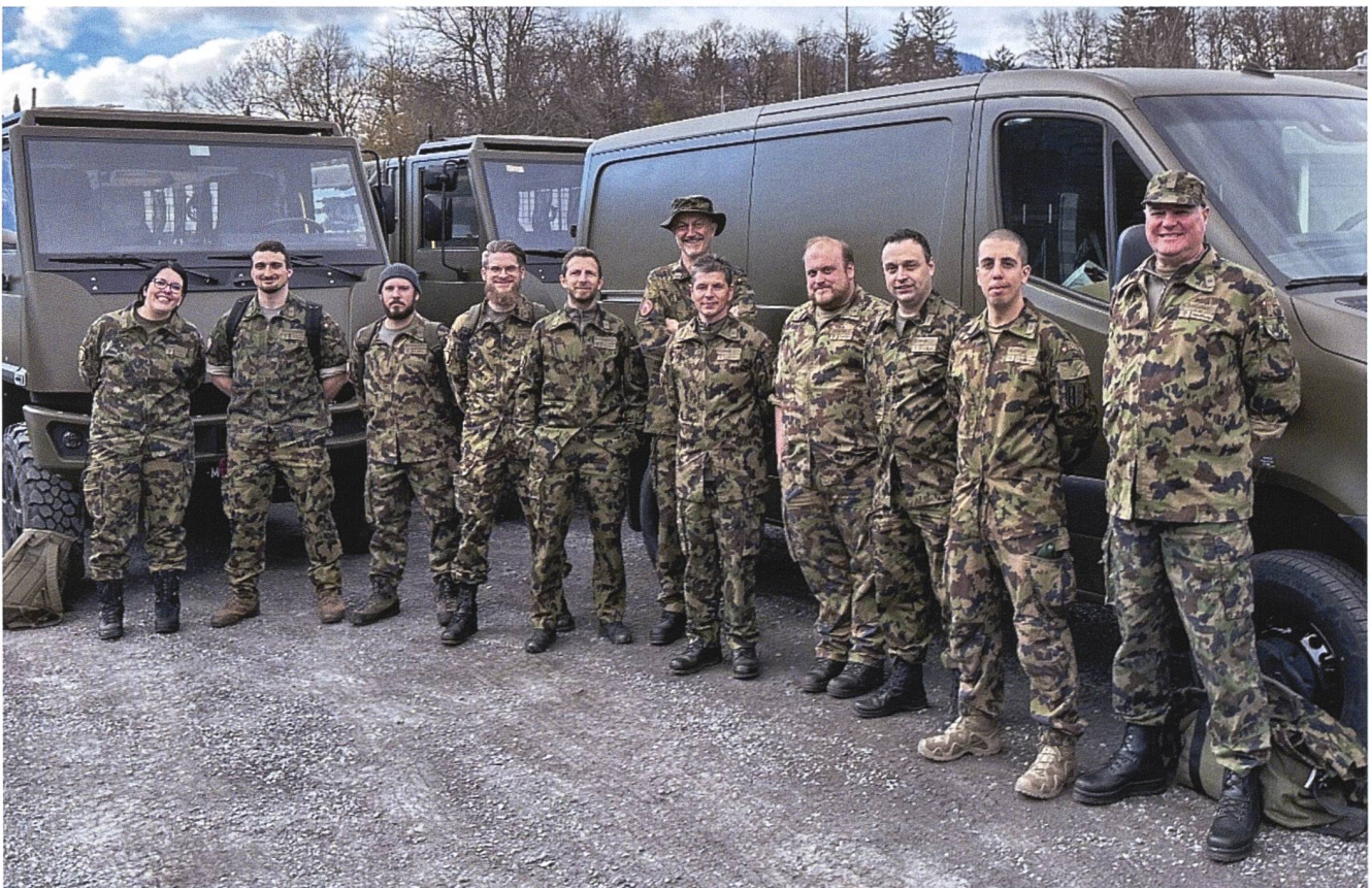
Fine impiego per il Distaccamento ATTM e per i responsabili auto al Military Cross 2023.