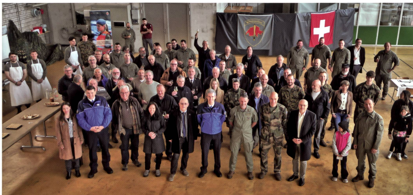
La giornata della PM offre sempre l'opportunità di interessanti conversazioni tra camerati svolta oltretutto in combinazione con la giornata dei pensionati.

Questi cambiamenti hanno ovviamente conseguenze sul materiale, sull'istruzione e sul personale. «Sarebbe disastroso voler adempiere i compiti di oggi con i mezzi del passato», ha aggiunto con tono incalzante. Già oggi è pertanto necessario pensare al futuro, valutare con lungimiranza le possibili conseguenze e integrarle sul piano concettuale. I diversi incarichi esclusivi della polizia militare hanno un'influenza diretta sulle risorse materiali e di personale. Inoltre, sempre secondo Droz, sono essenziali forti rapporti di partenariato con le truppe e i loro comandanti, nonché con i vari corpi di Polizia civili. Per far sì che in caso di evento reale la collaborazione funzioni, è necessario definire, allenare e consolidare i legami di cooperazione. Sebbene la sua attività miri perlopiù alla prevenzione