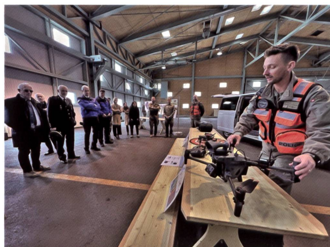
Ai visitatori sono state presentate anche le esclusive capacità dei nuovi droni.