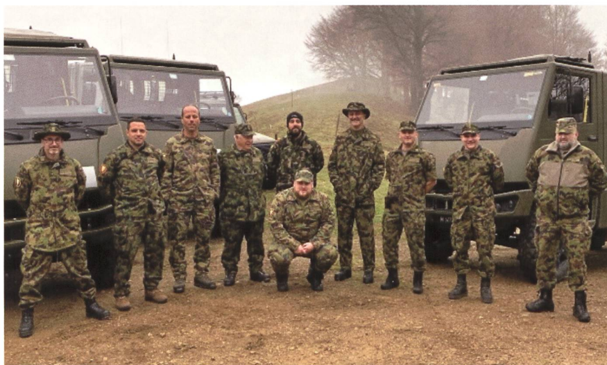
Una parte dei partecipanti al Corso, in posa e in azione.

classificati) e un ricco bagaglio di esperienza da spendere nell'organizzazione delle future gare ticinesi. Ecco uno stralcio della loro relazione: "la Gara si è rivelata una manifestazione molto interessante e variegata. Pianificata su una durata di circa trenta ore ben si capisce come all'importante attività di guida si siano alternati momenti di attività militare, di riposo e ristoro. La competizione vera e propria è iniziata alle 13.00 di venerdì 20 maggio e si è conclusa sabato alle 18.00 circa. Venerdì ci sono state prove nel pomeriggio e nelle ore serali-notturne, la cena in comune con relativa visita a un museo militare privato (che comprendeva innumerevoli pezzi della storia militare Svizzera) e il pernottamento in un accantonamento predisposto. Nel corso del sabato si sono svolte nuovamente missioni. Il pranzo è stato offerto allo stand dove si sono svolte le competizioni di tiro, le