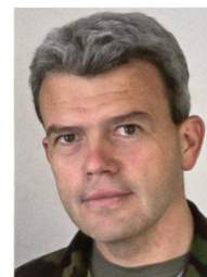
col SMG Theodor Casanova

colonnello SMG Theodor Casanova capoprogetto "Chance Armée"