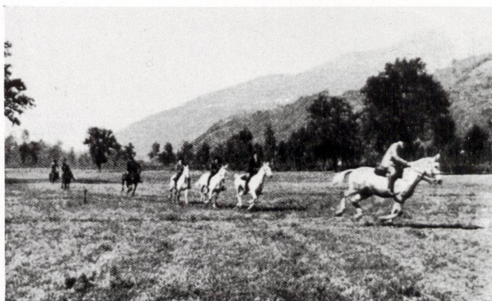
Verso il finale... (Tenuta «Bally»)