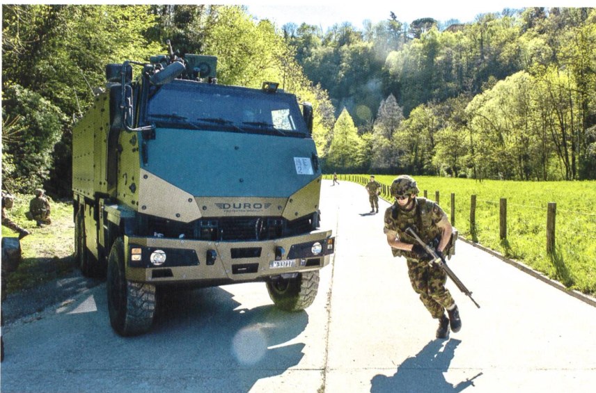
Alcuni esponenti dei Volpodinghi alle prese con i militi del bat fant mont 30