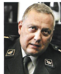
brigadiere Denis Froidevaux

Il Presidente della Società Svizzera degli Ufficiali traccia un bilancio dell'attività della SSU nel 2015 ed analizza i prossimi passi del progetto USEs (Ulteriore Sviluppo dell'Esercito).