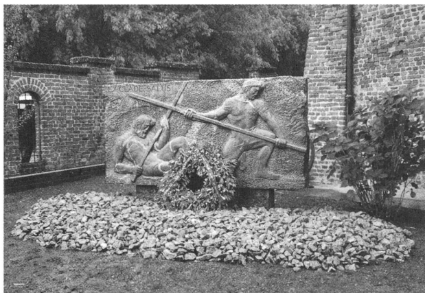
EX CLADE SALUS