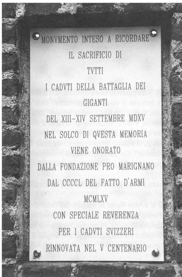
Il cippo a Santa Maria di Zivido