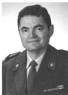
brigadiere Hans Schatzmann nuovo comandante della Sicurezza militare

Hans Schatzmann, 53 anni, ha studiato diritto presso l'Università di Berna. Dopo un periodo di attività come giudice istruttore straordinario del Cantone Soletta, nel 1992 ha conseguito il brevetto di avvocato e notaio. Dal 1993 al 2013 è stato titolare di uno studio legale e notarile a Soletta. Dal 2008 al 2012 ha presieduto la Società Svizzera degli Ufficiali. Nel 2014 è stato nominato comandante della brigata di fanteria 5, con contemporanea promozione al grado di brigadiere. Egli subentra al brigadiere Beat Eberle, che lascerà il DDPS a fine anno.