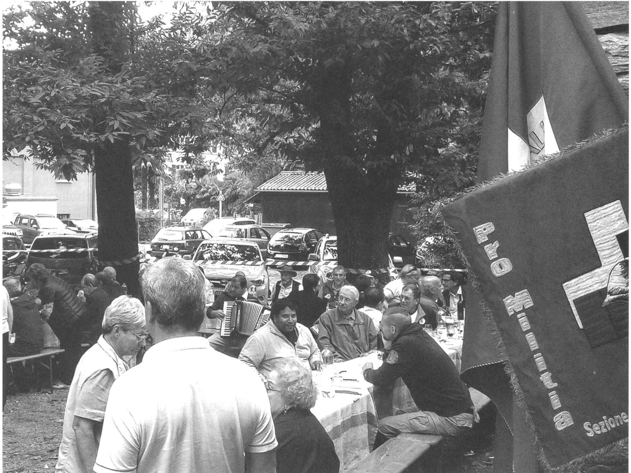
Dopo il tiro, la festa