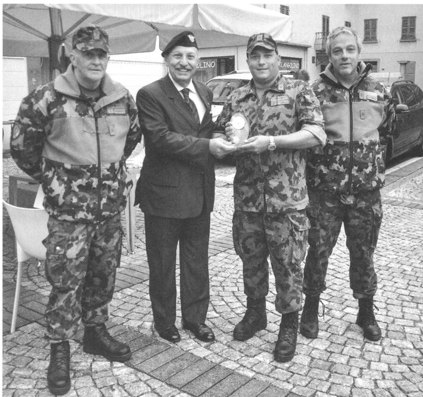
Premiazione del Re del tiro

Con l'ausilio anche di circa 40 collaboratori, appartenenti all'Assu Bellinzona - alla Sezione ticinese delle Donne nell'Esercito (DNE), di un distaccamento della Protezione Civile Regione Tre Valli e alcuni membri della Società di tiro del Gottardo di Airolo, la competizione ha riscontrato un ottimo successo di consensi e di apprezzamenti positivi da parte di tutti i partecipanti.