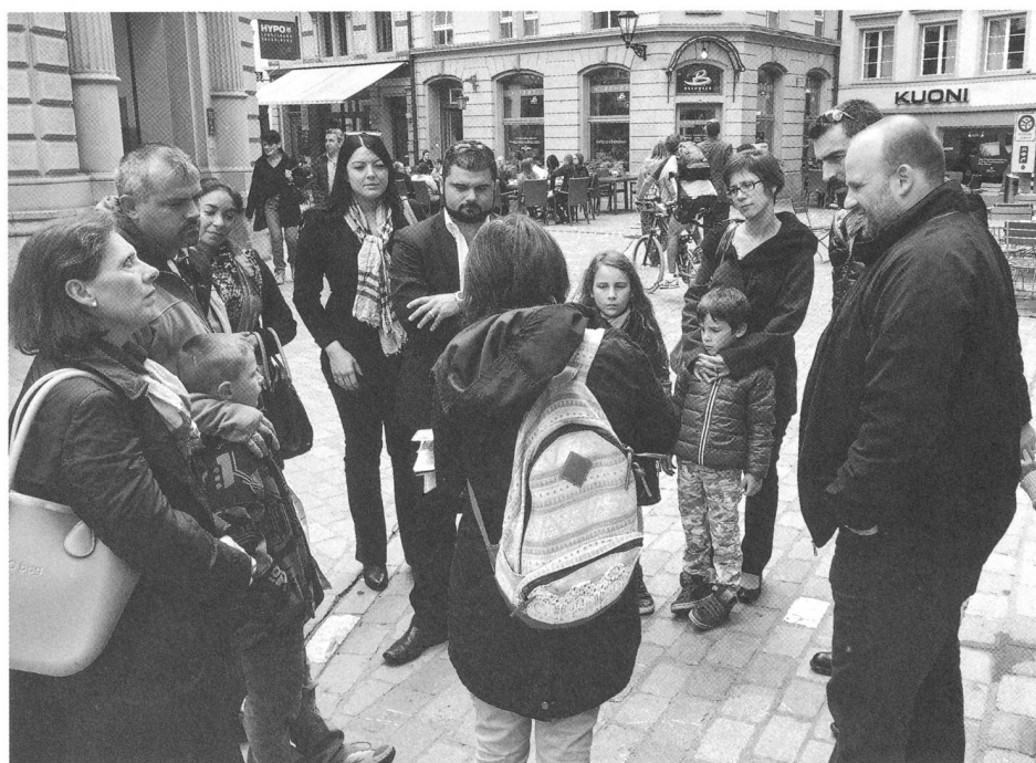
Visita della città