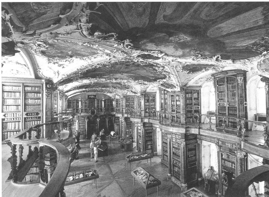
La sala barocca della biblioteca abbaziale, Abbazia di San Gallo Patrimonio-UNESCO

In questo luogo è conservato il Codex Abrogans, probabilmente il più antico testo in lingua tedesca esistente contenente il primo Padre Nostro in tedesco. ■