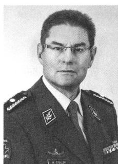
brigadiere Melchior Stoller, nuovo sostituto del comandante delle Forze terrestri e promosso a divisionario

Domiciliato a Neuenegg (BE), 54 anni, dal 1999 è stato comandante delle scuole sottufficiali e scuole reclute sanitarie di Losone/Tesserete e successivamente comandante delle scuole sottufficiali e scuole reclute d'ospedale a Moudon. Capo della logistica nello SM di condotta dal 2004 al 2008, in seguito comandante della brigata logistica 1e dal 2011 comandante della Formazione d'addestramento della logistica.