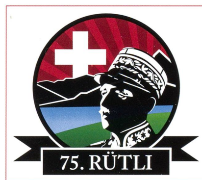
SSU Operazione Grütli