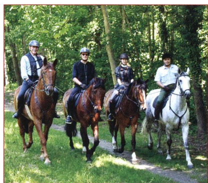
Circoli 20 anni CIU